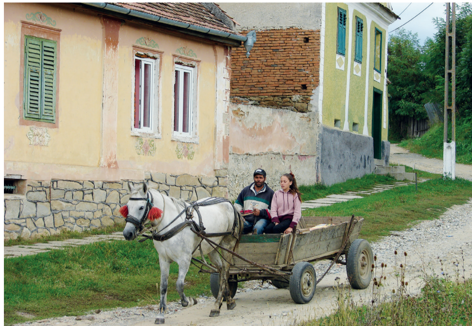
Cheval et charette, un moyen de transport courant en Roumanie

Depuis bientôt dix ans nous habitons le village de Hosman en Roumanie dans un vieux moulin: Domi, Gabi, Lujiza et Jochen.