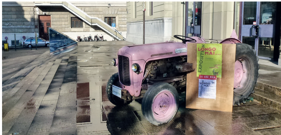
La star de l'expo: le petit tracteur rose provençal trône à Genève

très tard. Entre-temps, un petit peu moins de monde pour les autres soirées, toutes d'une très grande convivialité et pleines d'émotion. Les très beaux