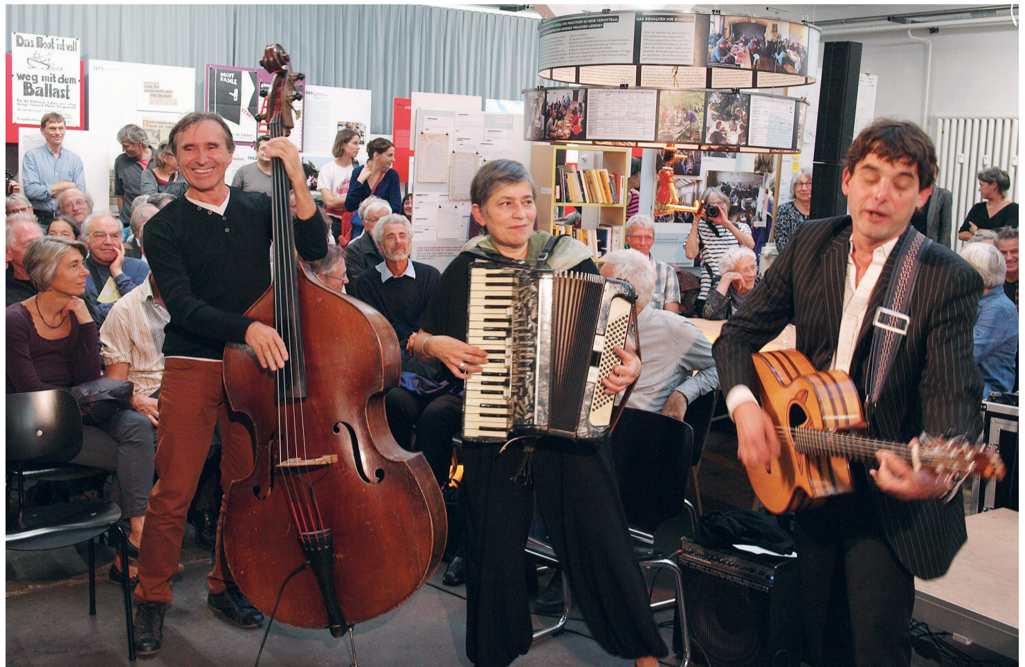
Comedia Mundi, le groupe de musique de Longo maï: une bonne ambiance au vernissage à Bâle, prochainement à Lausanne ...

La Fondation Longo Maï accepte des héritages et des legs. Commander la brochure à: Fondation Longo Maï, Case Postale, CH-4001 Bâle