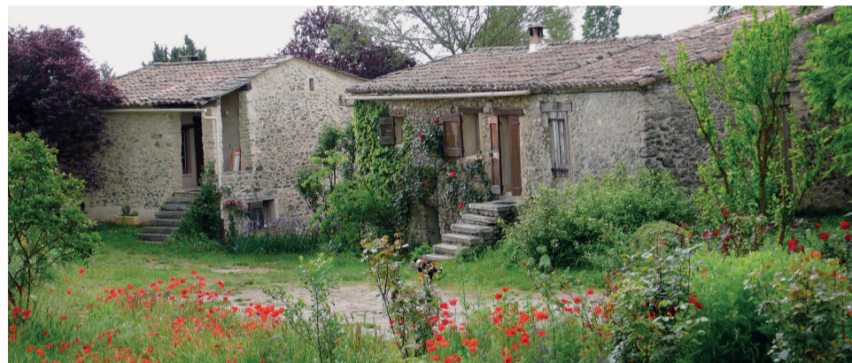
Les maisons de vacances ont été restaurées selon la tradition provençale

En 1979, nous avons entrepris la reconstruction des ruines du hameau «les Magnans», à 14 km de notre coopérative de Limans (Provence). Avec le soutien de notre cercle d'amis, nous avons fait appel à un petit entrepreneur en bâtiment de Forcalquier qui les a transformées en gîtes de vacances. Depuis, le hameau ne désemplit pas: nous recevons des familles, des amis curieux de visiter nos coopératives provençales tout en profitant du charme