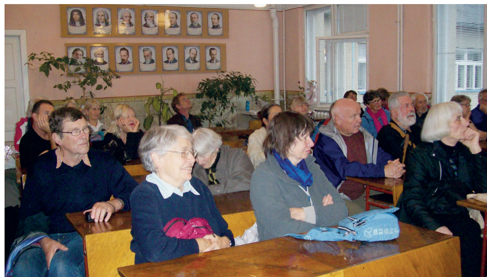
On s'est même retrouvés ensemble sur les bancs de l'école: visite de l'école à Nijnié Sélichthché

De façon générale, nous fûmes abondamment gâtés avec des délices culinaires dont le détail ne saurait être énuméré ici par un manque de place certain qui interdit du même coup de faire l'inventaire de toutes les conversations à propos d'amitié, d'amour et de projets futurs... constamment arrosées de vodka. Traverser tout cela demande quelque peu d'endurance.