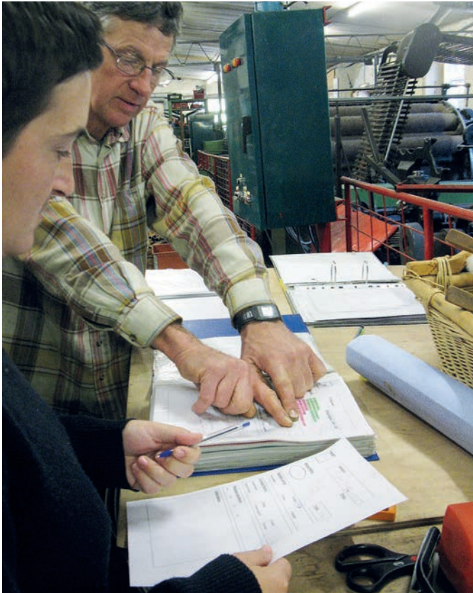
Un chantier de cette taille nécessite une bonne planification.

nous cache, produire de l'énergie propre devrait être une évidence.