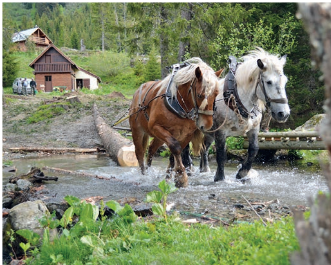
La traction animale – un vieux métier qui était en voie de disparition, irremplaçable pour ménager les fragiles sols forestiers.