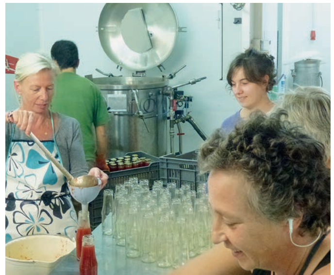
La conserverie en Crau s'ouvre aux besoins des maraîchers de la région. L'autoclave (au fond) a été renouvelé au bon moment.

Nous fûmes obligés de faire une mise à jour complète et coûteuse des conditions de travail et des conditions de transformation des produits ainsi qu'une nouvelle cartographie a posteriori de l'autoclave. Heureusement la coopérative en Crau a pu, grâce à la solidarité de l'ensemble des autres coopératives, passer ce cap. La voie est dorénavant ouverte. Que ferait un petit producteur seul face à cette montagne de contraintes?