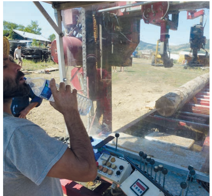
Les bûcherons de la coopérative de Treynas se forment au sciage. Ils viennent d'acquies un nouveau modèle de scie mobile.

En ce qui concerne la commercialisation alternative, il y a beaucoup à inventer. Si nous voulons avancer économiquement sans nous faire dévorer par la logique du marché, il nous faudra trouver un bon équilibre entre un apport extérieur de savoirs en «marketing» et les critères d'une économie solidaire. Cela ne coule pas de source. Mais avec notre pragmatisme acquis pendant 40 ans, nous sommes confiants de trouver la voie juste.