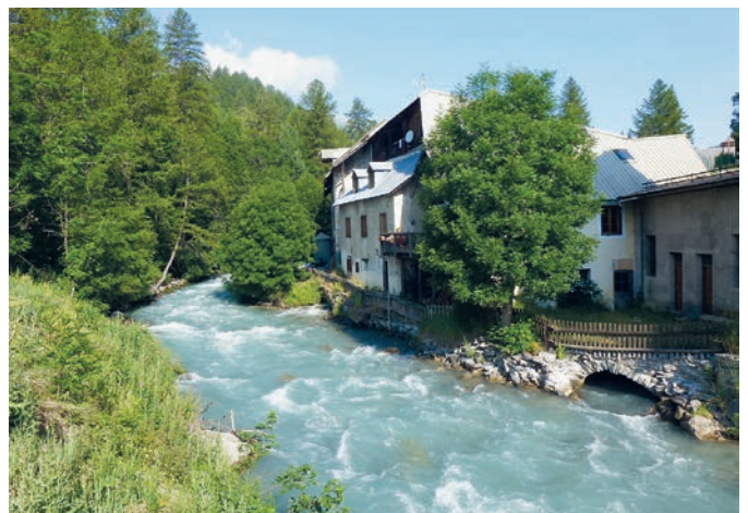
La filature au bord de la Guisane. Un torrent de montagne avec ses humeurs dans les Hautes-Alpes.