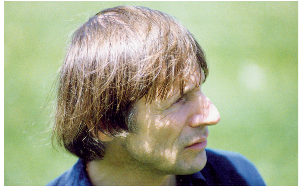
Dimitri à la ferme de Joli Mas en 1986

«Nous vivons dans le bien-être et nous avons tout. Comme ce serait bien si nous pouvions être plus tolérants, au-delà de toutes les considérations politiques. Nous devrions dans tous les cas nous comporter humainement». C'est ce qu'a déclaré le clown Dimitri depuis Verscio pour apporter son soutien à l'«Action Places Gratuites» après le putsch au Chili en 1973. Dimitri ne s'est pas contenté des paroles, il a lui-même accueilli des réfugiés chiliens chez lui.