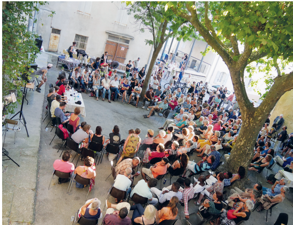
Soirée publique à Forcalquier pendant la rencontre à Longo maï: débat sur la migration.

L'idée d'organiser cette rencontre nous est venue lors de la réunion intercoopératives de janvier dernier. De l'idée à sa réalisation, le chemin fut ardu.