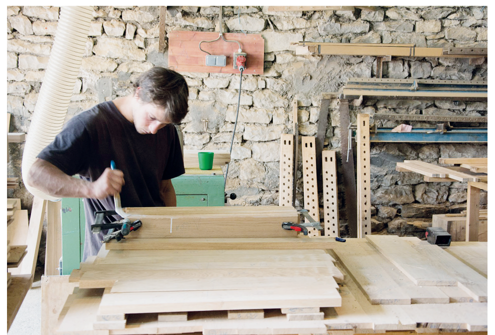
La menuiserie prend des commandes payantes et soutient d'autres groupes par solidarité.

beaucoup de commandes de menuiserie... Ils ont réalisé beaucoup de chantiers d'entraide, dans les coopératives de Longo maï, mais aussi pour