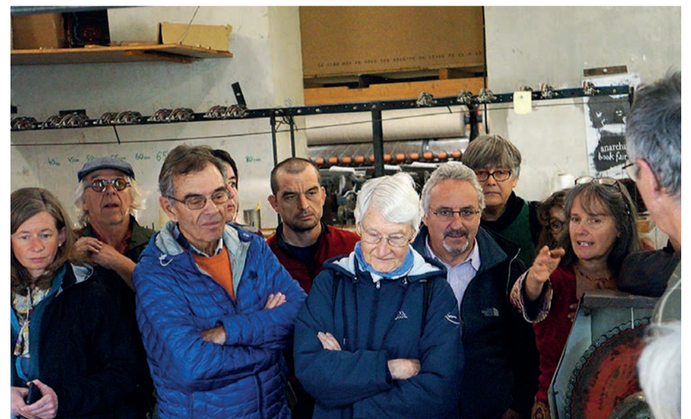
Etonnement autour des nombreuses étapes de la transformation de la laine