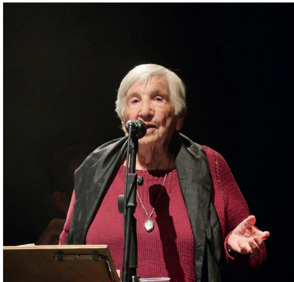
Esther Bejarano, l'un des derniers témoins de l'Holocauste, raconte son histoire.

Début octobre 2016, nous avons accueilli en Provence le groupe de rap allemand Bejarano & Microphone Mafia pour une tournée de concerts et de lectures.