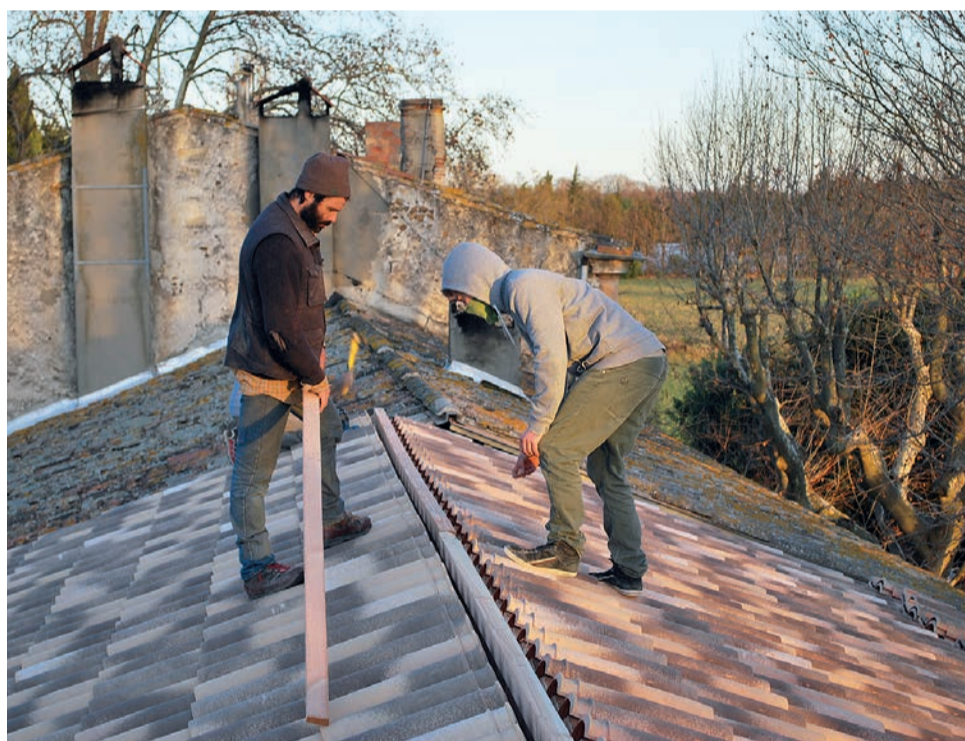
Le toit est presque fini, il va protéger les habitants contre le mistral glacial.

Deux jeunes habitants du Mas de Granier sont partis à Longo maï Treynas en Ardèche pour scier le bois et avoir une première impression de la charpenterie. La conception a été élaborée par Treynas. Pendant les deux semaines du chantier, des novices ont pu disposer d'assez de temps pour