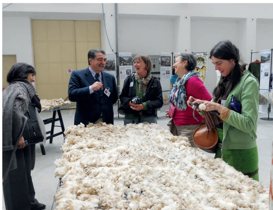
Lors de l'exposition «Wools of Europe», les visiteurs se familiarisent à la texture de la laine.

Alpes européennes. Chaque année, la laine de 11 000 moutons environ y est transformée en pull-overs, chemises, tissus, couvertures, laine à tricoter et autres puis vendue sur des marchés régionaux ainsi que parmi le cercle des amis de Longo maï. Mais nous sommes un cas particulier. Au début des années 2000, les grandes crises