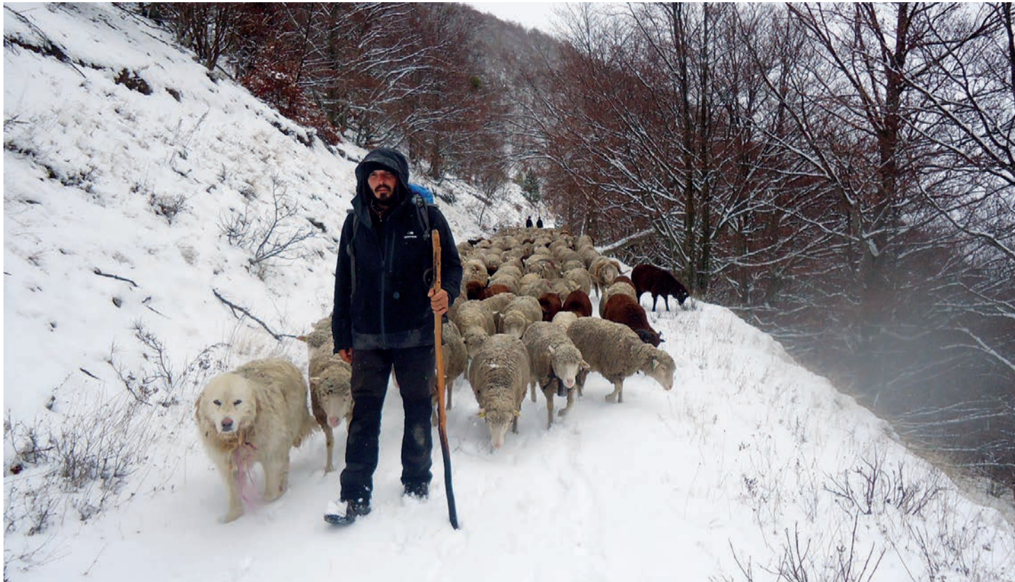
Pendant la transhumance automnale vers la Provence, les moutons et leurs gardiens se font surprendre par une tempête de neige.