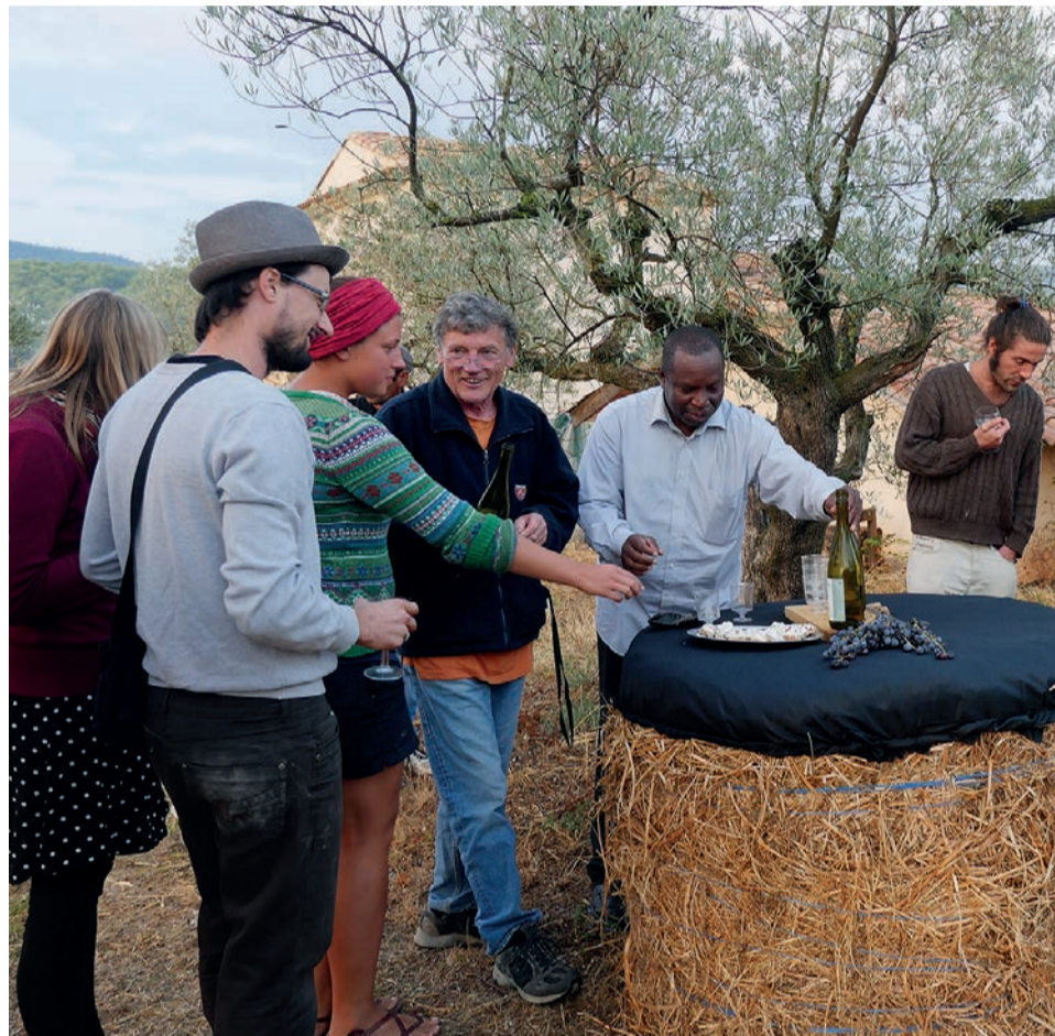
Pause conviviale autour du vin, du fromage et du raisin

les vendanges sont des moments favorables à l'échange, la rencontre festive et l'accueil de jeunes et moins jeunes, venus d'autres coopératives de Longo maï et d'autres horizons. Ces moments traditionnels, peu à peu remplacés autour de nous par le bruit des