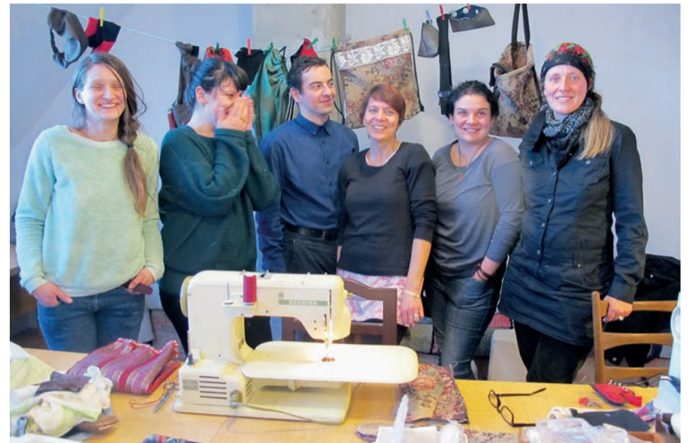
Un stage de couture qui s'achève dans la bonne humeur

Fin mai, le projet «Solidarité pour un développement économique dans la vallée de Harbach – SOLID.E.D.» est arrivé à son terme. L'association Pro Longo maï y était l'organisation partenaire de nos amis de l'association Hosman Durabil et du vieux moulin d'Hosman. Plus de 200 personnes ont participé aux stages proposés dans le cadre de ce projet cofinancé