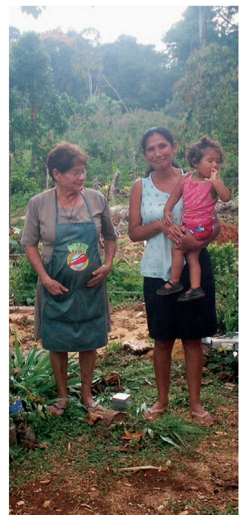
Le début d'une nouvelle vie au Costa Rica

* Selon la mythologie courante des Maras et une théorie correspondante sur son origine, le mot «Mara» avec lequel les gangs se désignent eux-mêmes, est entré en Amérique Centrale dans le vocabulaire courant et dans les textes de lois; il est probablement une forme raccourcie de Marabuntas, nom d'une espèce de fourmi migrante présente en Amazonie, Cheliomyrmex andicola , qui envahit massivement une zone et détruit tout sur son passage.