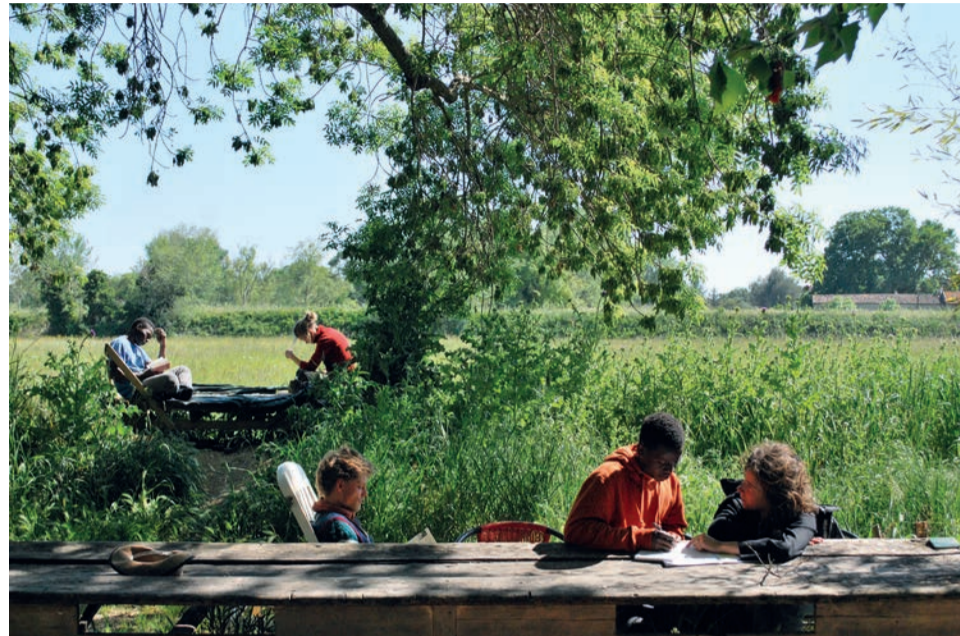
École interculturelle buissonnière au Mas de Granier

L'accueil de réfugiés dans nos coopératives soulève beaucoup de questions concernant le vivre ensemble ainsi que le contact avec les institutions.