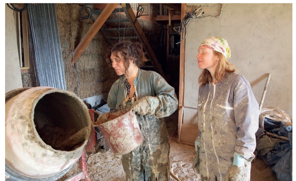
Un bon mélange est indispensable!

Cet hiver la plupart des fenêtres ont été installées dans notre maison commune à la coopérative de Limans en Provence, ce qui nous a permis d'être à l'abri des courants d'air et de pouvoir réaliser la dernière couche des enduits intérieurs en terre et sable de 8 chambres dans de bonnes conditions. C'est un professionnel de la région qui nous a conseillés en nous montrant sa recette du mélange et sa technique à la fois rapide et efficace. Des équipes nombreuses et renouvelées nous ont permis de bien avancer. Ensuite, au printemps, nous avons pu nous attaquer à la pose des planchers de l'étage qui doivent offrir une bonne isolation phonique, ce qui n'est pas évident dans une maison à ossature bois. Nous nous étions documentés