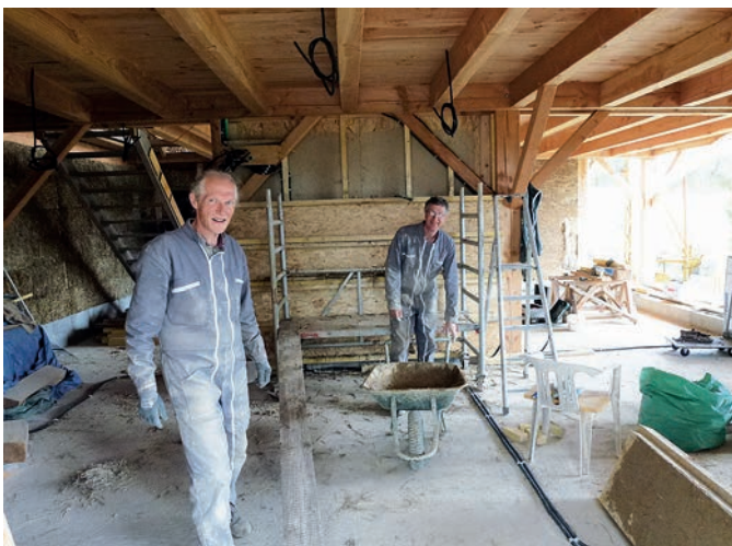
L'aménagement intérieur de la nouvelle maison commune.

Au printemps, la dernière aile du hameau de St. Hippolyte a été couverte. Le chantier de la bibliothèque