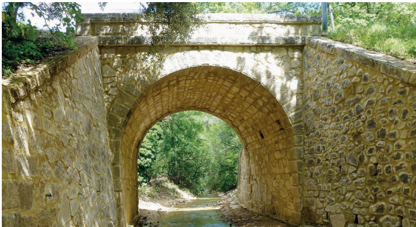
Au début de l'été, la rivière en bas de la colline de Longo maï en Provence n'est plus qu'un maigre filet d'eau.