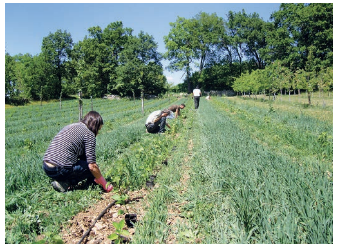
L'irrigation a permis d'augmenter la surface des jardins.