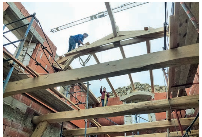
La magnifique charpente en chêne et châtaignier de la future bibliothèque de St. Hippolyte.