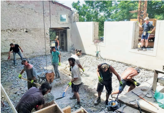
La salle de Grange neuve en juin 2017: «Du passé faisons table rase» – démolition en cours.

pourra se poursuivre à l'abri. Dans la nouvelle maison commune, les travaux d'aménagement intérieur se sont poursuivis par la pose des planchers et des huisseries. Les habitants pourront emménager au cours de l'année 2018.