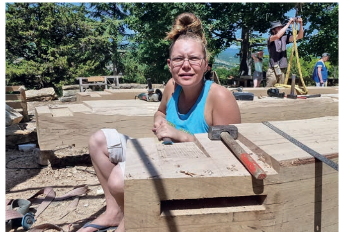
La sculpture de ces entailles demande beaucoup de précision.