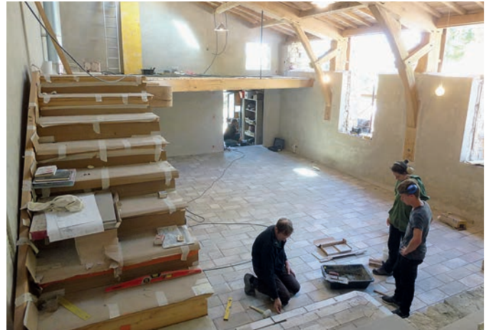
La salle de Grange neuve en septembre 2017: bientôt la fin des travaux.

Malgré les tracas de l'été la salle de Grange neuve est terminée et a retrouvé sa fonction de salle à manger collective, de lieu de réunion et d'accueil. La réha-