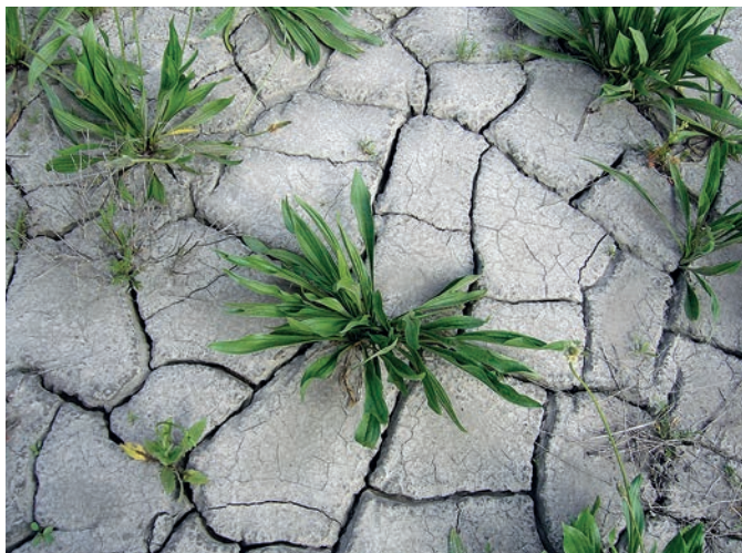
La terre desséchée: seul ce courageux plantain résiste encore.

Cet été encore, nous avons été contraints d'organiser collectivement des limitations de la consommation d'eau. L'irrigation est réduite au minimum vital, nous avons installé à proximité de Grange neuve et du Pigeonnier des toilettes sèches qui permettent d'économiser 2m 3 par