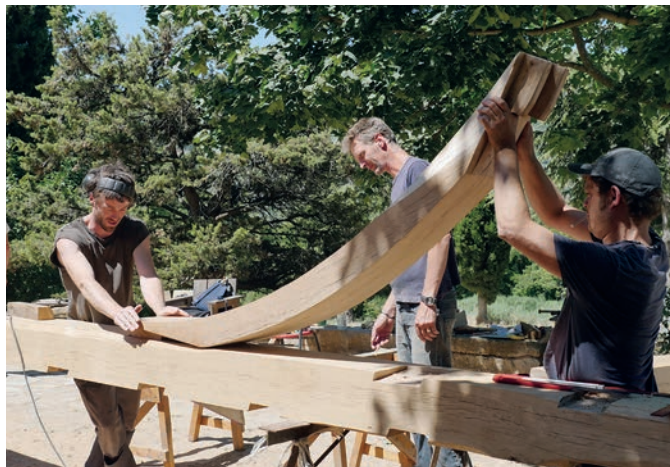
Les artistes de la charpente vérifient l'assemblage des différents éléments.

bilitation du hameau n'est pas terminée pour autant. La prochaine étape sera la rénovation de l'ensemble des installations sanitaires. Ce chantier au cœur de la coopérative a été un très beau moment de convivialité et d'accueil des nouveaux arrivants. Il a permis à beaucoup de se former ou de continuer à se former aux différents métiers du bâtiment, particulièrement la charpente et la menuiserie.