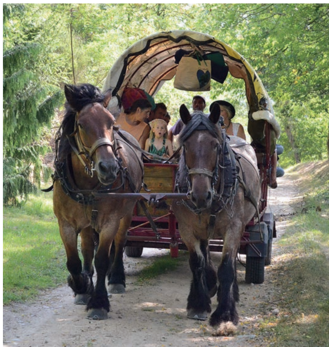
Les deux juments aiment promener tout ce petit monde.