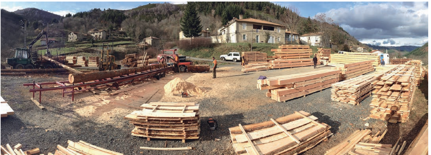
Des poutres, des chevrons, des planches pour le prochain chantier de charpente.