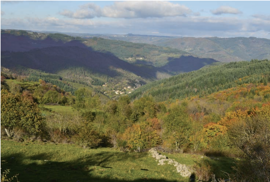
La forêt du Massif Central. «La Grangette» au-dessus de notre village de Chanéac.