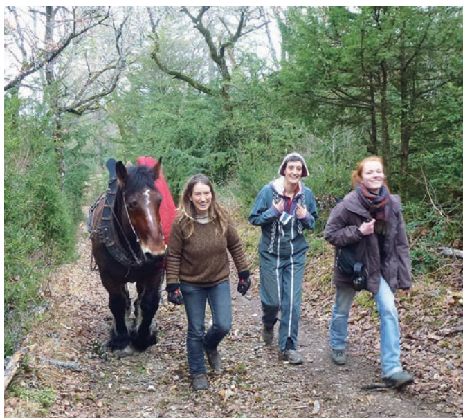
La forêt nous donne plus que du bois...