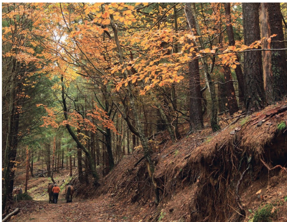
Il est temps de rentrer. La forêt nous donne un sentiment de paix...