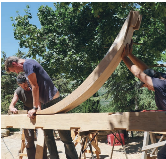
L'assemblage de la charpente: Précision et bonne coordination.

Certains d'entre nous ont appris la menuiserie, d'autres sont maintenant des charpentiers expérimentés et, depuis quelques années, nous avons une scie mobile qui fonctionne presque en continu. Jusqu'à présent les scieuses et scieurs et la scie sont constamment exposés aux intempéries. Nous avons donc décidé de construire un grand hangar de scierie, de menuiserie et de parquetierie. Il sera situé sur un terrain à mi-chemin entre le hameau de Treynas et le massif forestier sur une terrasse déjà utilisée pour le stockage des grumes. Il sera entièrement construit en bois, avec une longueur de 40 m et une largeur de 20 m, c'est un défi pour nos charpentiers, une œuvre à la hauteur de ce projet ambitieux.