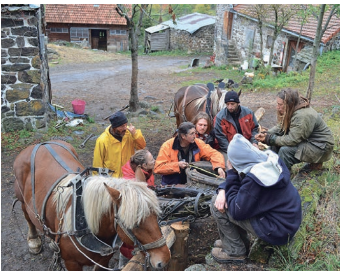
Petit complot entre amis avant la journée de travail.

La coopérative de Treynas existe depuis 45 ans. Toutes ces années ont permis de développer un concept