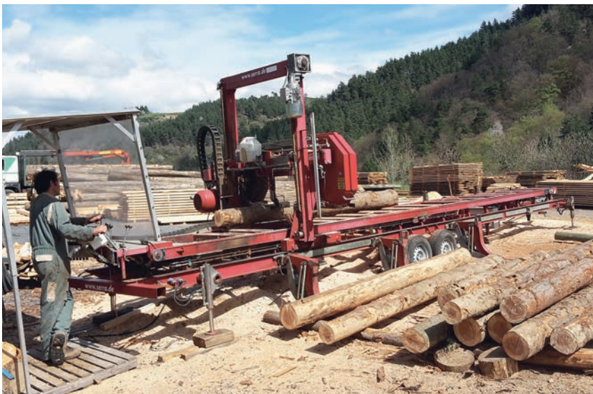
Jusqu'à présent la scie, les scieuses et les scieurs ne sont pas à l'abri des intempéries.

Sa motivation était guidée par le refus d'une société qui promettait le bonheur pour tous et toutes à travers la consommation illimitée de biens matériels. Nous sentions confusément que cette économie ne tournait pas rond. Pour créer des espaces dans lesquels une autre façon de vivre et de travailler serait possible, nous avons parfois un peu forcé le destin. A partir du travail quotidien dans le jardin, dans l'agriculture, sur l'alpage, à la filature ou dans la forêt qui est présente dans toutes les coopératives, ont été pensées les filières d'activités. De la matière première jusqu'au produit transformé. La trame d'une nouvelle économie? Les premiers jalons ont été posés avec la filature, la conserverie, le moulin et la boulangerie. Maintenant, les