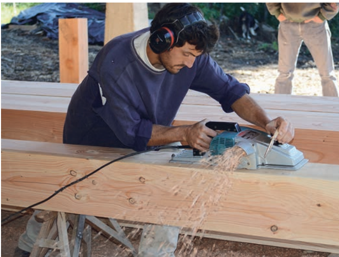
Un travail bien pensé se déroule bien.

Nous voulons bâtir un petit complexe de transformation du bois. Ce bâtiment, tout en bois, couvrira une surface de 40 m sur 20, donc 800m 2 . Il abritera la scie que nous avons déjà acquise qui occupera la moitié de la place. L'autre moitié, chauffée en hiver, sera occupée par l'unité de production de parquet, des machines de menuiserie et une étuve pour sécher les planches. Raboter, rainurer, moulurer les bois en sortie de sciage crée une plus-value et dégage un marché intéressant. Les produits proposés seront le parquet, le bardage mural et le lambris pour les plafonds. Les trois disponibles en différentes espèces et qualités de bois naturel. Jusqu'à présent nous ne pouvons pas répondre aux demandes de parquets et autres bois rabotés parce que nous n'avons pas les outils nécessaires.