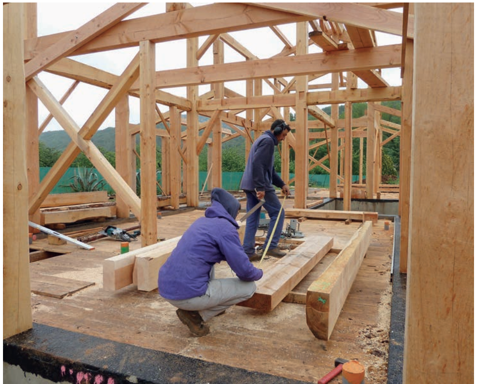
Le métier de charpentier demande beaucoup d'intuition et une bonne maîtrise de la mesure.

La forêt est à la fois source de vie et la mémoire des temps anciens, un lieu de régénéscence et de croisement, elle répare sans condition une partie de notre pollution. Notre approche du travail forestier respecte les écosystèmes et favorise la diversité des espèces. Pas question pour nous de faire des coupes rases ou